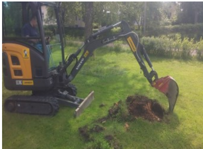
År 2015 hyrde vi en grävmaskin för att utföra arbeten vid Fontanas gård. / vuonna 2015 vu- okrasimme kaivinkoneen jotta voimme suorit- taa työt Fontanan pihalla.