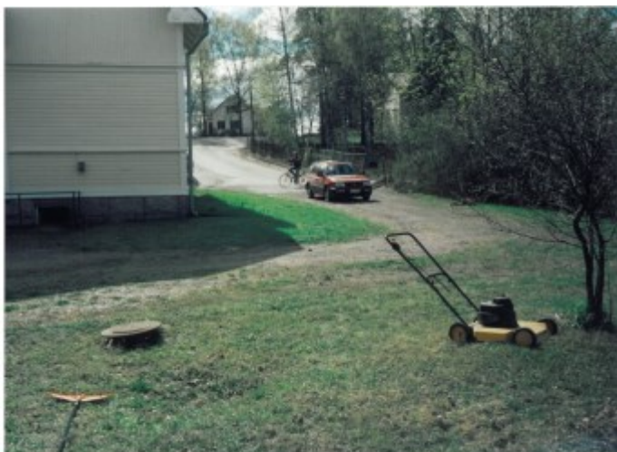
Fontanas gård/ Fontanan piha 1999.