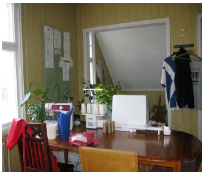
Övre rummet/ Yläkerran huone 2015.