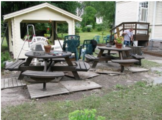
Spår från översvämningen 2013./ Jäljet tulvasta 2013