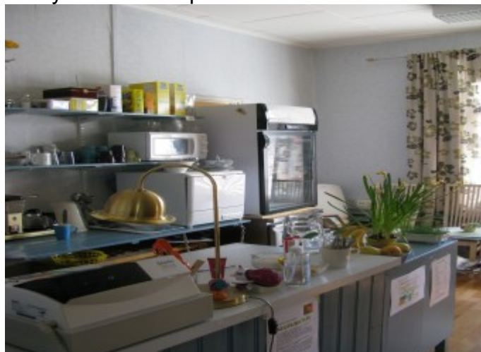
Café/ Kahvila 2015.